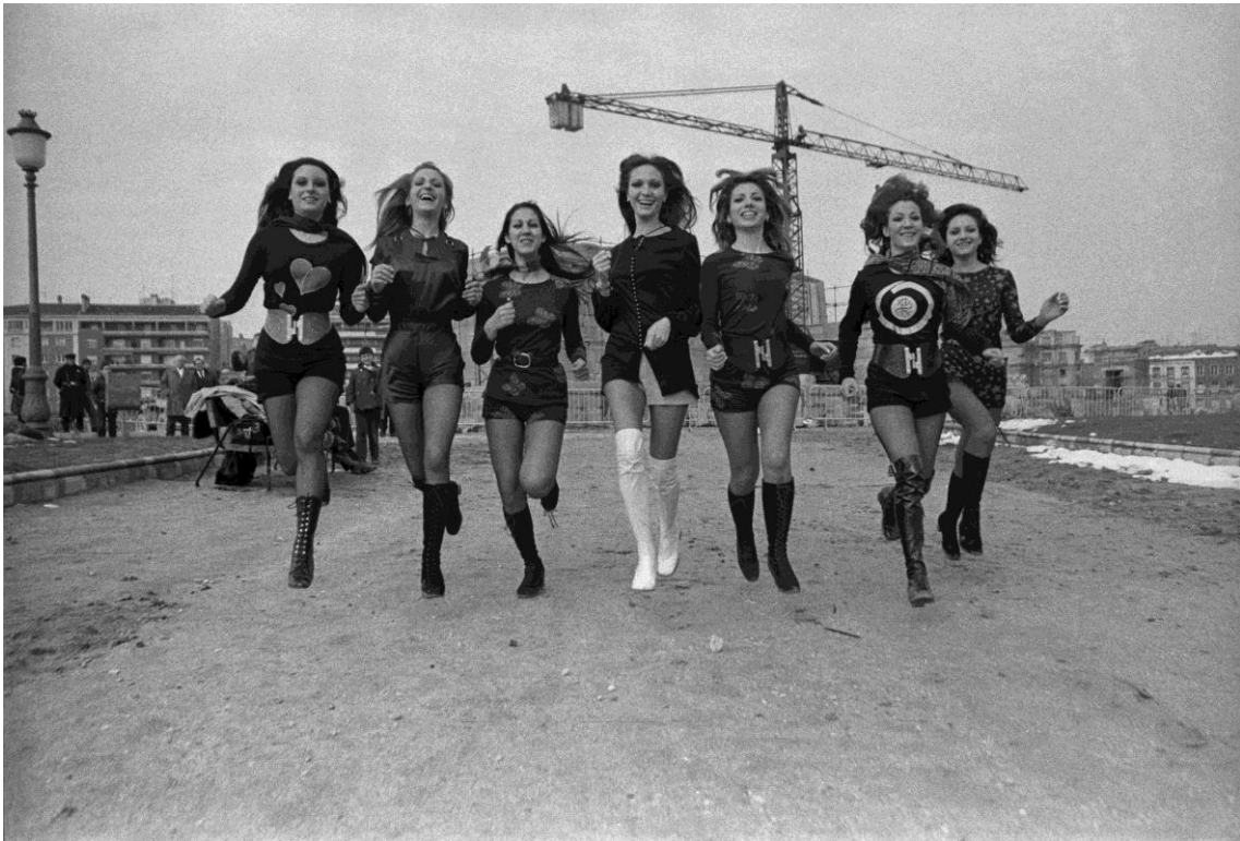
CHICAS CON SHORTS: Modelos con los shorts de moda. Editorial realizado a las afueras de Madrid. 1971

Comisario: Josep Casamartina i Parassols