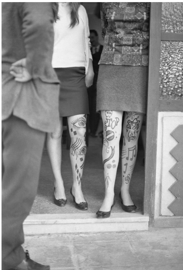
Editorial de moda "Piernas pintadas", Madrid, ca. 1966

La dedicación de la fotoperiodista Joana Biarnés al ámbito de la moda fue una tarea intensa que inició en Barcelona y consolidó en Madrid, desde final de los años cincuenta hasta los primeros setenta, y resume toda una época que capta sin afectaciones ni esteticismos. Cuando Biarnés se introdujo en el mundo del glamur hacía tiempo que trabajaba como fotoperiodista, puesto que era la primera mujer que se dedicaba a esta profesión en España, y sería la pionera, también como mujer, en la fotografía de moda.